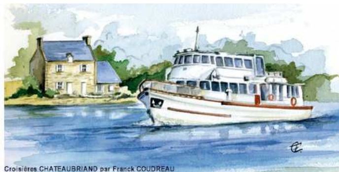
Croisières CHATEAUBRIAND par Franck COUDREAU

CONDITIONS GENERALES DE VENTE Notre tarif groupe est applicable à partir de 25 personnes voyageant ensemble et valable sur la période du 1 NOVEMBRE 2017 au 31 MARS 2018 hors réveillons et jours fériés. Les prix comprennent le menu, la croisière de 3 heures, l'apéritif et les boissons. L'acompte à verser à la réservation ferme représente 50 % du montant de la dépense envisagée. Le nombre de participants devra être confirmé 48 heures avant la date retenue. Passé ce délai, le nombre réservé de participants sera facturé. Le solde de la facture devra être réglé au plus tard le jour même de la prestation avant l'embarquement. Les prix et la composition des menus seront maintenus dans la mesure du possible, sous réserve de disponibilité des denrées ou de variations importantes des cours. La Société Maritime Harbour se réserve le droit d'annuler ou de modifier les horaires pour des raisons d'exploitation, de marées ou autres impératifs. Ce document fait référence à nos conditions générales de vente.