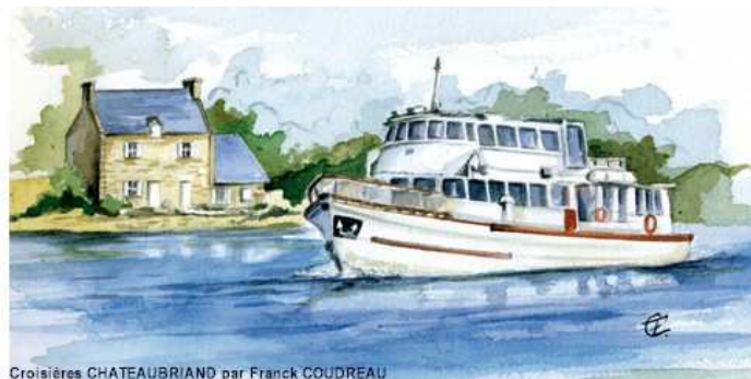
Croisières CHATEAUBRIAND par Franck COUDREAU